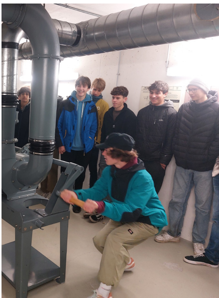
Schüler beim manuellen Betreiben der Belüftungsanlage (im Fall eines Generatordefekts)