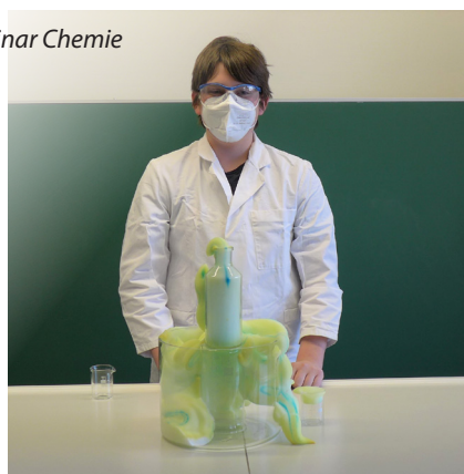
Euer P-Seminar Chemie

Also: zahlreich mitmachen, experimentieren und gewinnen! Wir informieren euch über den Start nochmal über das digitale schwarze Brett und Aushänge.